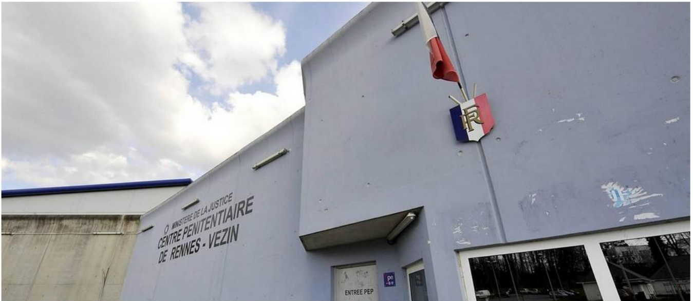
Vezin-le-Coquet, à l'ouest de Rennes, abrite déjà un centre pénitentiaire pour hommes. Il a ouvert, en 2010, et peut accueillir 850 détenus à la maison d'arrêt et au centre de détention.