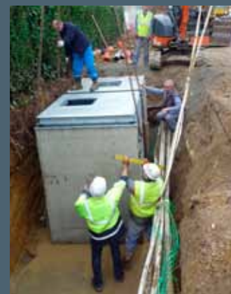
Mise en place, début décembre, des conteneurs à verres rue Jean Bart

Afin d'éviter l'encombrement des trottoirs et pour des questions d'hygiène, aucun contenant d'ordures ménagères ne doit être déposé sur la voirie en dehors des indications précitées. Il est rappelé que la responsabilité des usagers peut être engagée en dehors des jours de collectes.