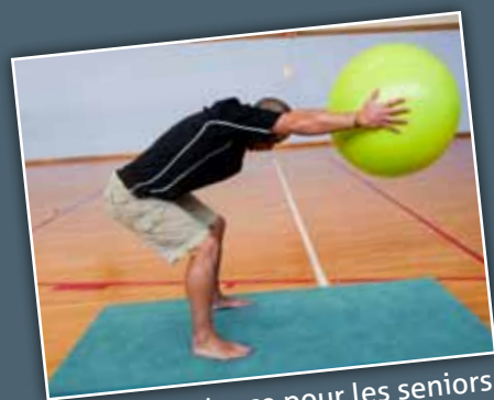
Activité douce pour les séniors

Outre les activités qui se déroulent à la piscine (aquagym, bébés nageurs...), le service sports et jeunesse de la commune propose deux animations :