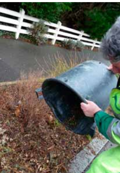
En 2011, 108 sapins de Noël ont été collectés et ont permis la réalisation de paillage.

Toute l'information sur www.ville-liffre.fr