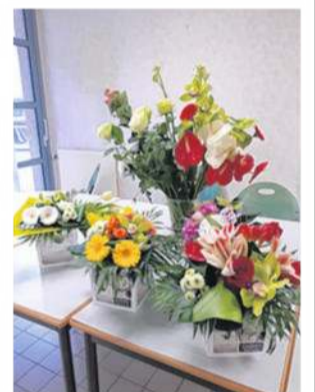
Le fleuriste de Fougères, Couleurs nature, fait partie des donateurs que le CH de Fougères tient à remercier.

Durant la crise sanitaire (lire notre dossier pages 14 à 16) de nombreux donateurs se sont manifestés auprès du Centre hospitalier de Fougères. Ils lui ont fait bénéficier de 8 985 masques FFP2, 12 400 masques chirurgicaux et 375 blouses et combinaisons. L'hôpital a également reçu en cadeau quelques kilos de gâteaux, croissants, chocolat, thé, café, fromage... mais aussi des chèques et des fleurs. De quoi faire plaisir aux soignants, patients et résidents.