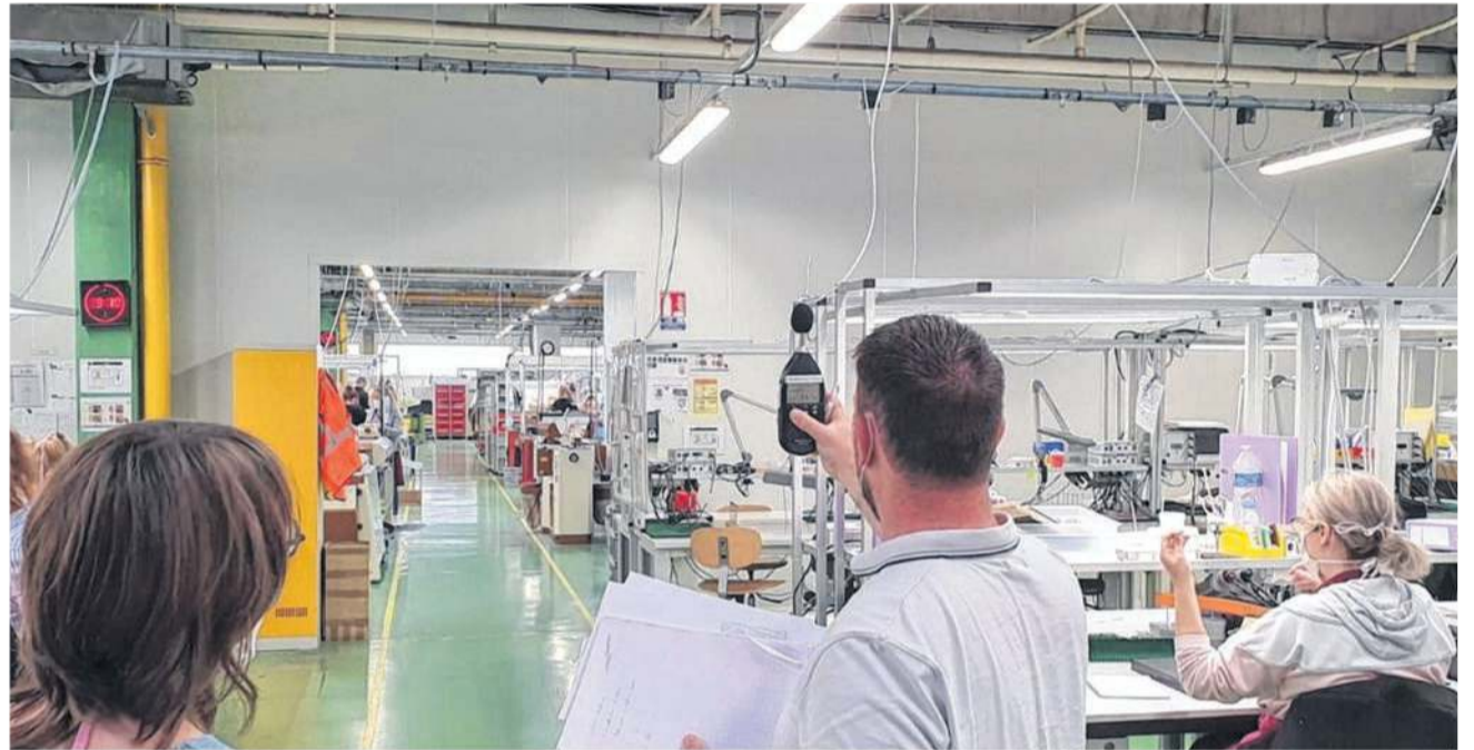
Un salarié de Santé au travail en pays de Fougères lors d'une intervention chez BFL à Fougères.

Mobilisée pendant le confinement et le déconfinement, Santé au travail en pays de Fougères a conseillé les entreprises sur les bonnes mesures à prendre pour la reprise.